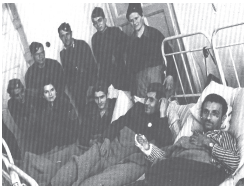
Slika 7. Grupa ranjenih boraca upućenih u bolnicu sa Sremskog fronta krajem 1944. godine.