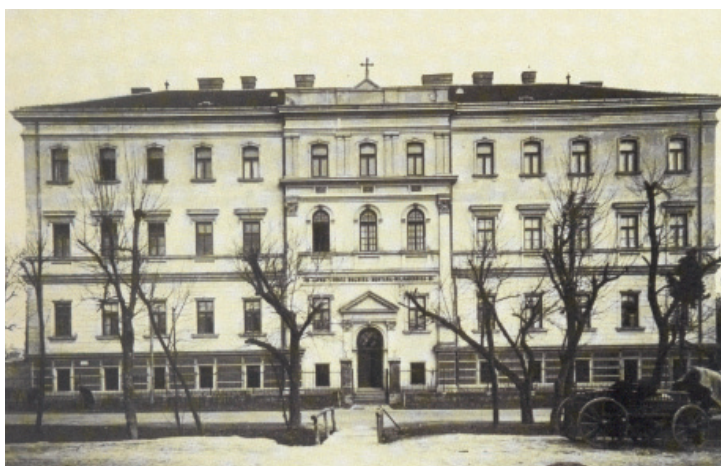
Slika 2. Prema planovima Franje Jenča 1905. godine je dograđen još jedan sprat na čeonom delu zgrade.

Nije nezanimljivo predočiti da su u zdravstvenoj službi Gradskog poglavarstva osim tri fizika bili i gradski veterinar, istovremeno upravnik Gradske klanice i nadzornik, i tri primalje. Prema Statutu grada Zemuna iz 1897. godine prvi fizik primao je, uključujući i stanarinu 1000, kotarski fizikusi po 850, veterinar 750, dok su gradske babice dobijale po 220 forinti. U gradu je radilo još 11 privatnih lekara opšte prakse (među njima 3 zubna) i tehničarka zubar. Tri apoteke snabdevale su bolničke ustanove i građane potrebnim lekovima. One su se nalazile u Donjem gradu: apoteka „Kod zlatnog orla” F. Zige (danas Trg pobeđe 18), „Kod sv. Trojstva” F. Benka (Ul. Glavna 33) i „Kod Salvatora” H. Strajma (Bežanijska 16).