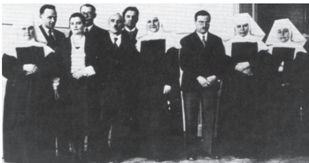
Slika 5. Uprava, šefovi odeljenja i lekari Javne opšte bolnice prilikom proslave četrdeset godina rada u novoj zgradi bolnice, 1931. godine.

Posle velikih novčanih izdataka, brige i truda svi poslovi bili su završeni do decembra. Prema želji upravnika, da bi se Bolnica predstavila široj javnosti i da bi se izrazila zahvalnost „mnogim visokim ličnostima”, rešeno je da se osvećenje novih prostorija „u velikom stilu” obavi 10. decembra. Ovom svečanošću ujedno se želelo obeležiti 40 godina rada u novoj, odnosno tadašnjoj bolničkoj zgradi (Slika 5.).